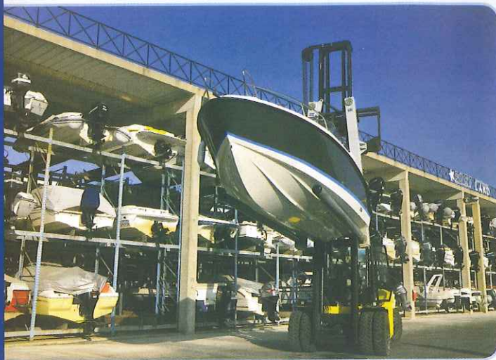
En pleine saison, 3 chariots élévateurs tournent en permanence pour gérer les 500 bateaux.